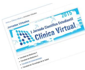
Fig. 2. Jornada Virtual

Lo anterior, posibilitó que en las diferentes carreras se desarrollaran las Jornadas Científicas Estudiantiles: I Jornada de Informática Médica y I, II Jornadas de Clínica Virtual así como las Jornadas de Clínica Virtual por especialidades: I, II de residentes de Imagenología y I de Ortodoncia (Fig. 2).