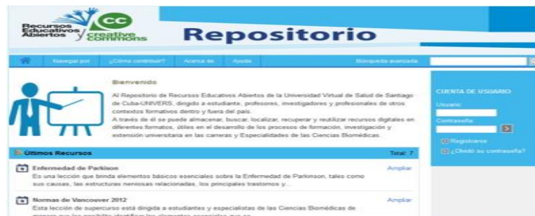
Fig. 4. Repositorio de Recursos Educativos Abiertos

También resaltan los objetos de aprendizaje disponibles en el Repositorio de Supercurso y el de Recursos Educativos Abiertos (Fig. 4).